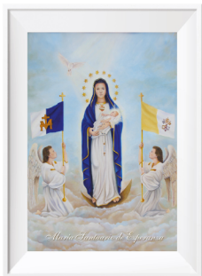
IMAGEN: MARÍA SANTUARIO DE ESPERANZA